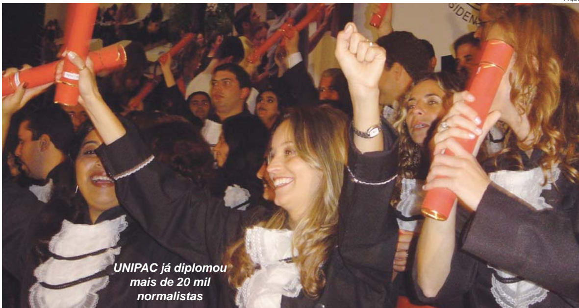
UNIPAC já diplomou mais de 20 mil normalistas

Rede de Faculdades da FUPAC/UNIPAC leva cursos superiores para todo o interior mineiro