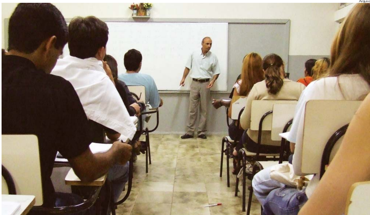
UNIPAC tem atualmente cerca de 51 mil alunos em todo o Estado

Do total de 1.837 instituições cadastradas e participantes das avaliações do